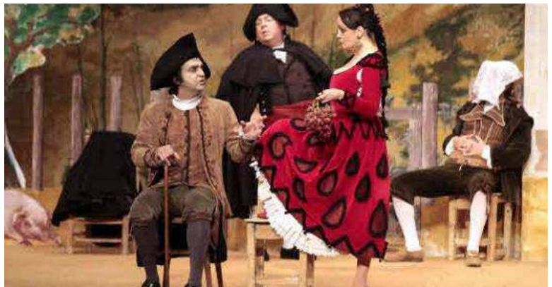
'El sombrero de tres picos' de la compañía Morfeo Teatro Clásico. Jorge Peteiro

17 de las 44 compañías son de la Comunidad y participarán en el certamen, que se celebrará en Ciudad Rodrigo entre los días 23 y 27 de agosto